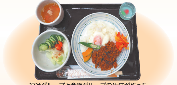
福祉グループと食物グループの生徒が作った キーマカレーです