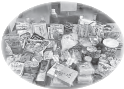
西脇南中学校で集まった食料品